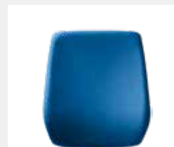
comfort plus: Hohe, höhenverstellbare Vollpolster-Rückenlehne (58 cm) vollumpolstert High, height-adjustable fully upholstered backrest (58 cm)