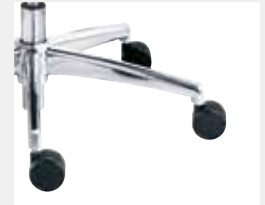
FFAPO Aluminium poliert (Option) Aluminium polished (option)