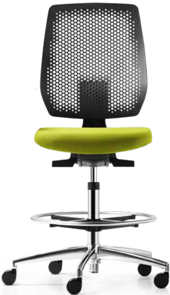
AU SP 7619_CFR membrane