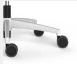
FFAVW Aluminium weiß (Option) Aluminium white (option)