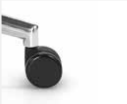
R75HGS (Standard) Schwarze Rollen, hart für weiche Böden Black castors, hard for soft floors