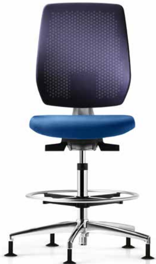
AU SP 7629_CFR style