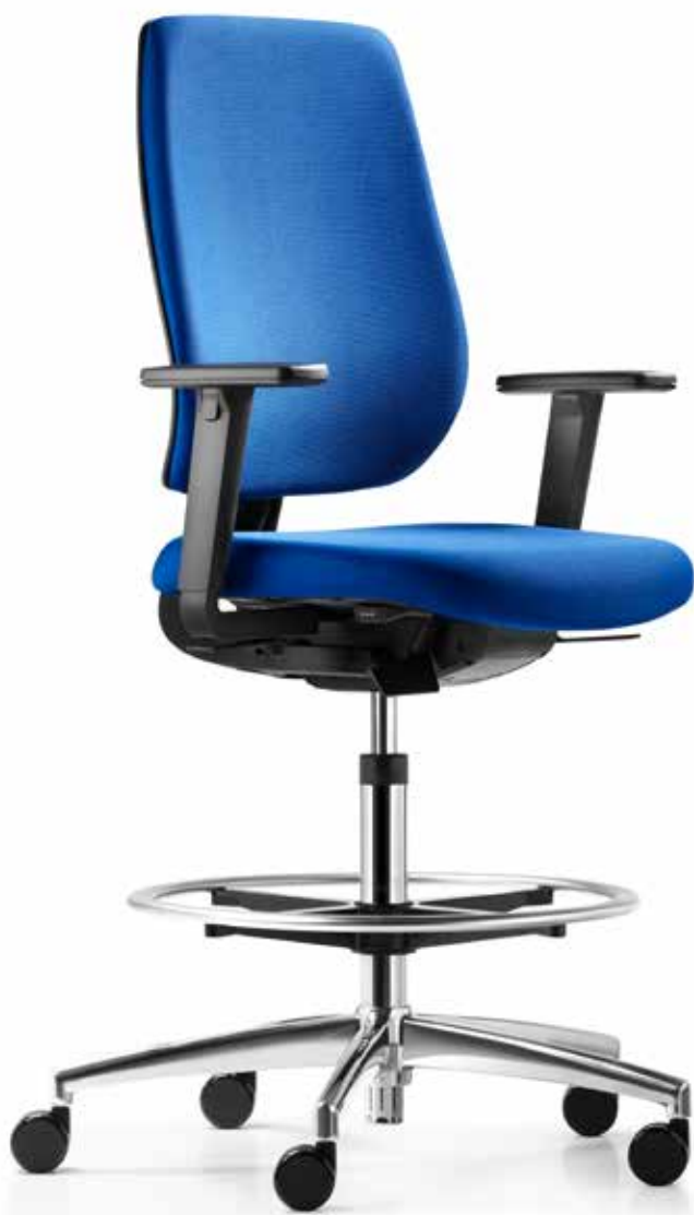
AU SP 7639_CFR comfort + Armlehnen | Armrests A208KGS

The speed-o counter model is the ideal seating solution for standing and temporary workstations. The load-dependent locking castors prevent the chair from accidentally rolling away when you put your weight on it. Alternatively, glides are available for stability. The height of the non-slip chrome foot ring can easily be adjusted. The Syncro-Relax-Automatic® mechanism also adjusts automatically to your body weight.